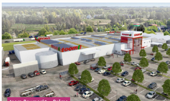
toom Baumarkt - Brême

Votre SCPI Opus Real termine l'année avec une distribution brute en progression à 61,06 €/part (contre 59,43 €/part en 2022), soit un taux de distribution de 3,0 %, en ligne avec la prévision déterminée en début d'année.